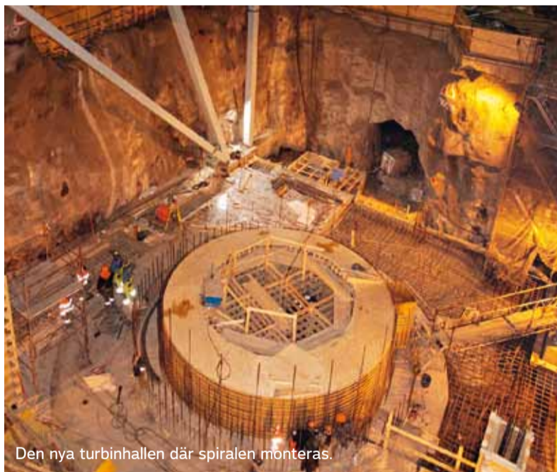
Den nya turbinhallen där spiralen monteras.

När dammen byggs och rivs kommer vattnet att vara grumligt några dagar. För att det inte ska påverka harrens lekperiod, byggs dammen när leken är avslutad. Den rivs efter två till tre månader.