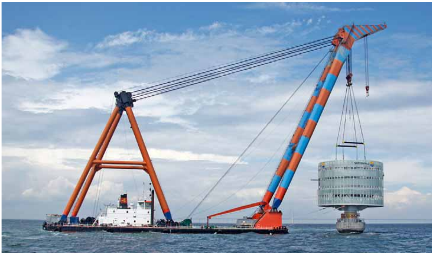
Transport och montering av vindkraftparkens transformatorstation, Lillgrund juni 2007

havs är hårdare med mer blåst, vågor, saltvatten och is. Det är också svårare att utföra reparationer till havs än på land. För att säkra drift och underhåll av vindkraftverk till havs, måste verken vara anpassade efter de marina förhållandena. Det innebär bland annat följande: