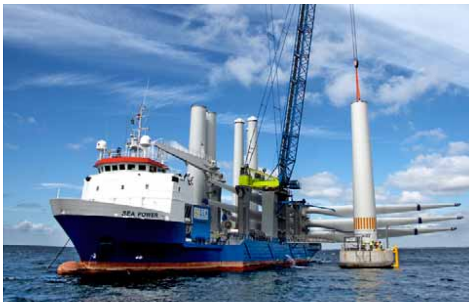
Montering av Lillgrund vindkraftparks första torn, juli 2007.

omfattar vindkraftverken, kabel, fundament, nautiska säkerhetsanordningar och flygsäkerhetsanordningar som till exempel de lampor för hindermarkering som vindkraftverken är utrustade med. Servicetekniker åker ut med båt till vindkraftverken för att underhålla, kontrollera och reparera vid behov.