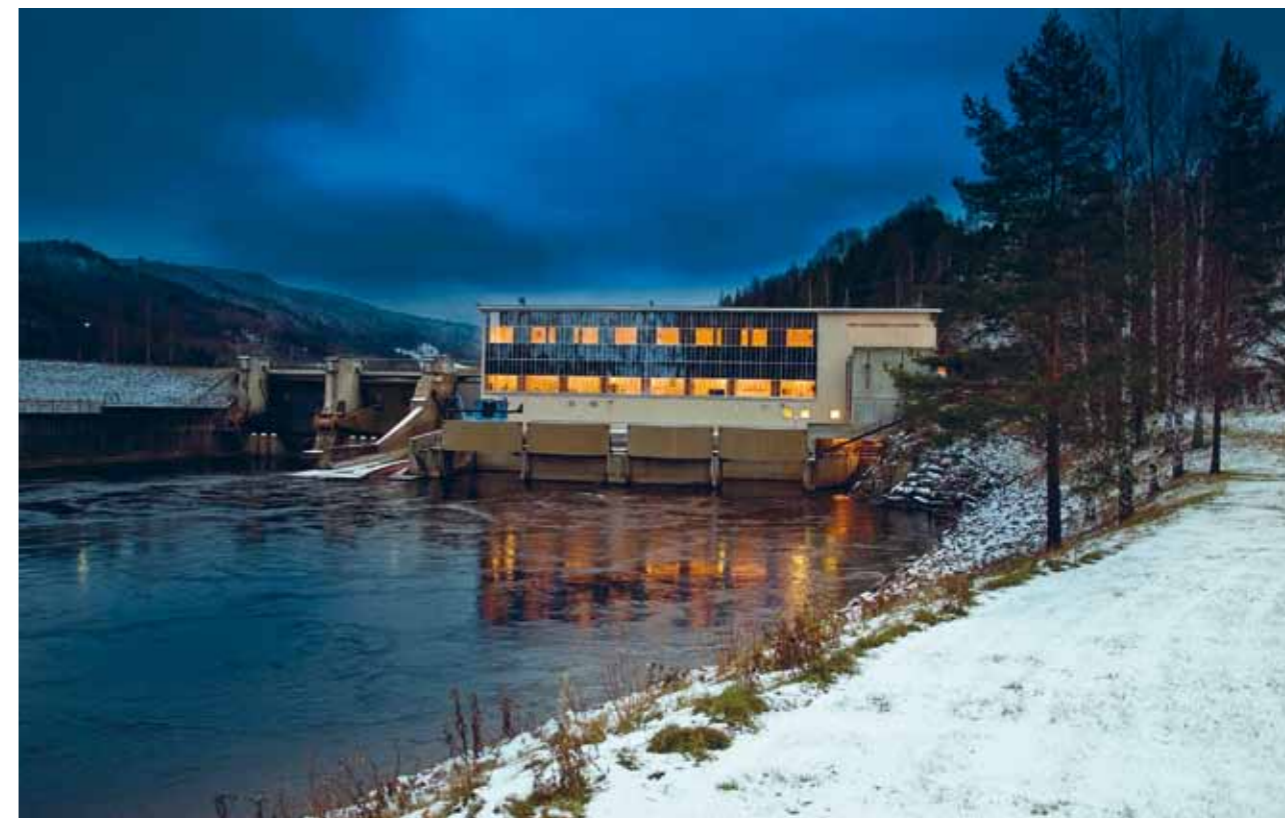
Järkvissle kraftverk i Indalsälven.

Omloppet av vatten är konstant. Genom att använda naturen på naturens egna villkor får vi tillgång till en hållbar och förnybar energikälla.