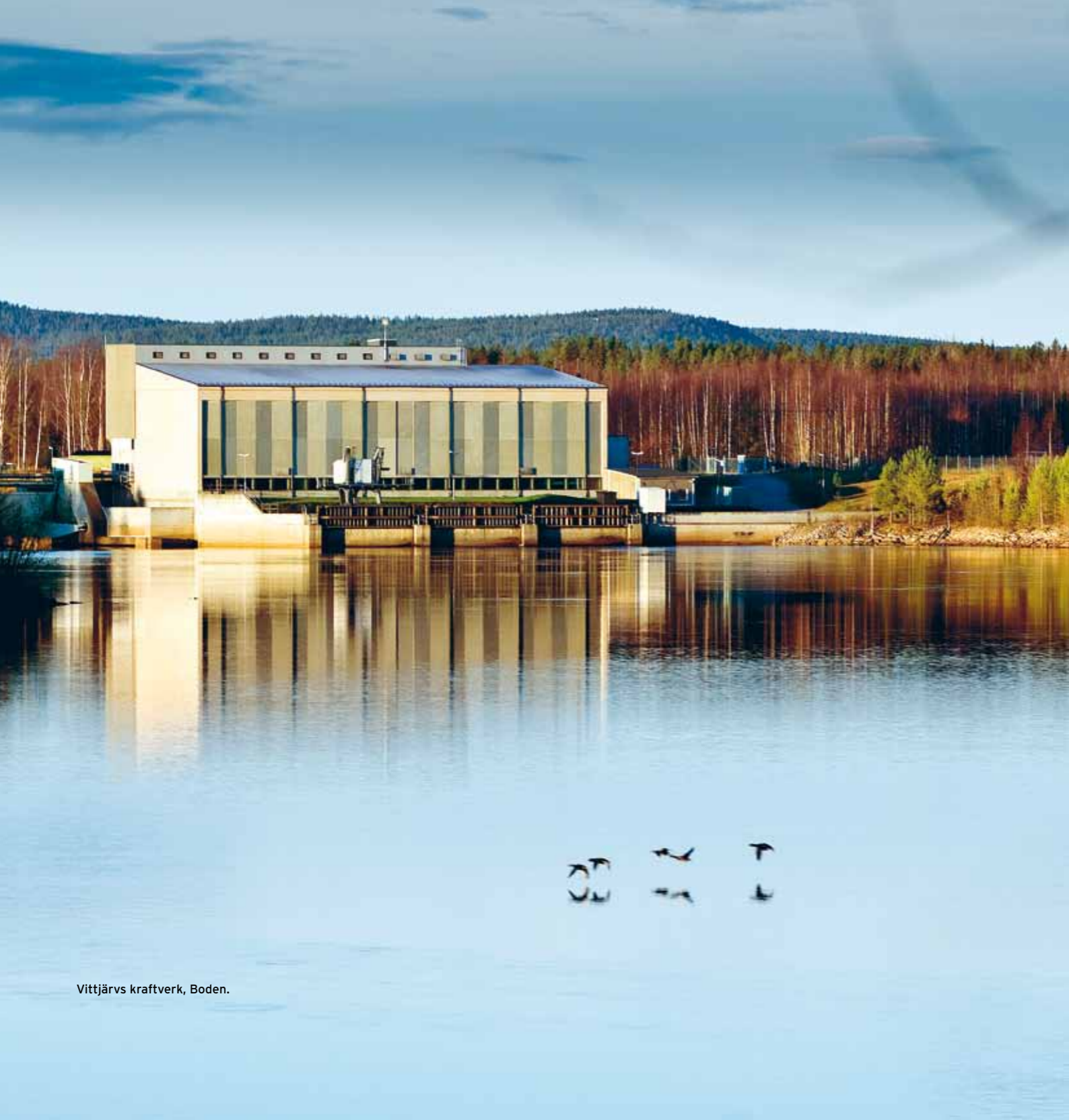
Vittjärvs kraftverk, Boden.