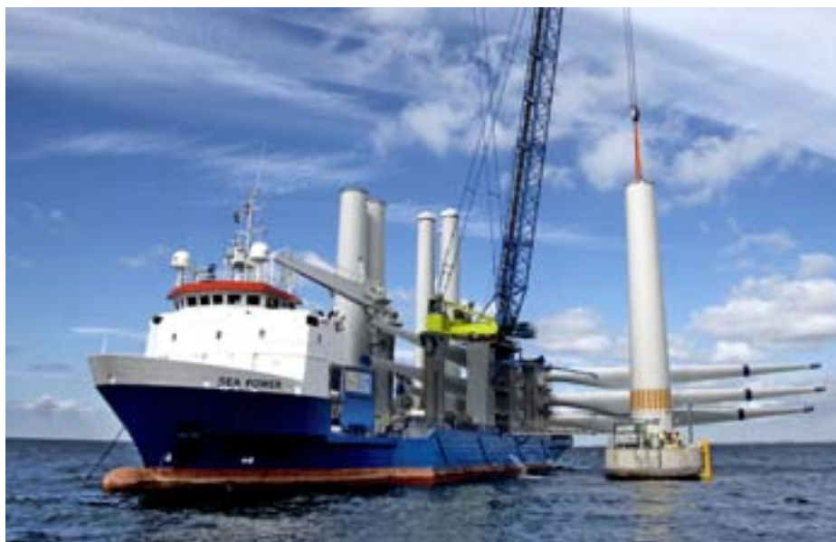
Montering av Lillgrund vindkraftparks första torn, juli 2007.

omfattar vindkraftverken, kabel, fundament, nautiska säkerhetsanordningar och flygsäkerhetsanordningar som till exempel de lampor för hindermarkering som vindkraftverken är utrustade med. Servicetekniker åker ut med båt till vindkraftverken för att underhålla, kontrollera och reparera vid behov.