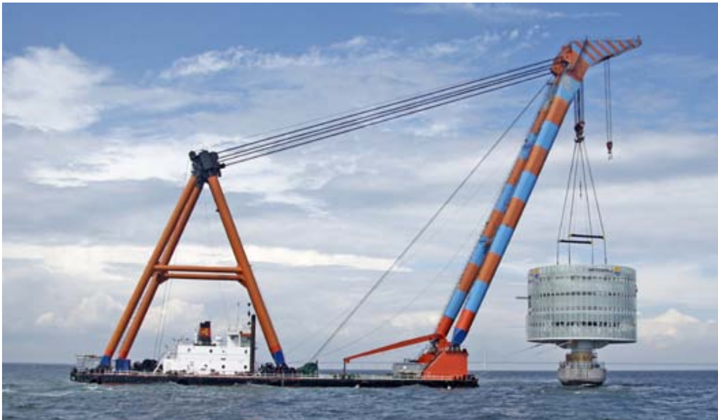
Transport och montering av vindkraftparkens transformatorstation, Lillgrund juni 2007.

saltvatten och is. Det är också svårare att utföra reparationer till havs än på land. För att säkra drift och underhåll av vindkraftverk till havs, måste verken vara anpassade efter de marina förhållandena. Det innebär bland annat följande: