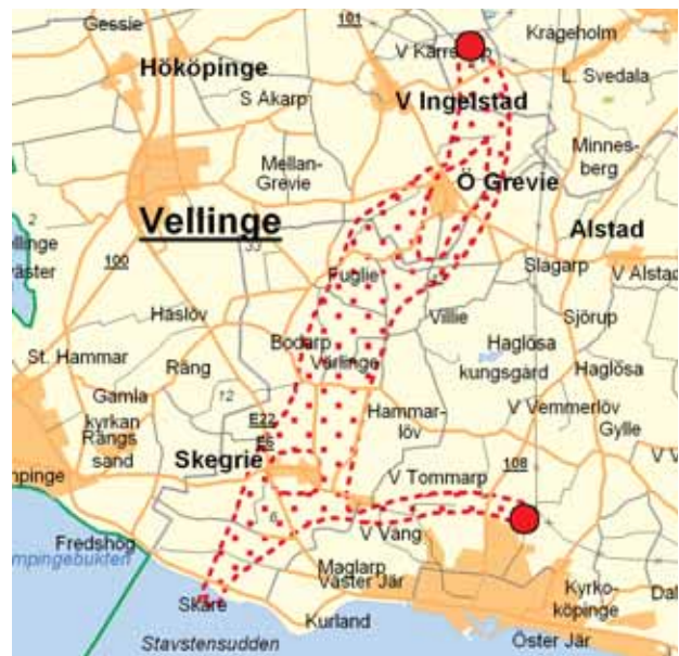
Utredningsområde för kabelsträckningen på land. Exakt sträckning är inte klar.

Samråd sker med dem som kan tänkas beröras av projektet, till exempel kommuner, statliga verk och enskilda. Syftet med samråden är bland annat att inhämta synpunkter och att få en ökad kunskap om förhållandena inom utredningsområdet. Genom samråden ges möjlighet att medverka och påverka det fortsatta utredningsarbetet. Samråden sker enligt Miljöbalken.