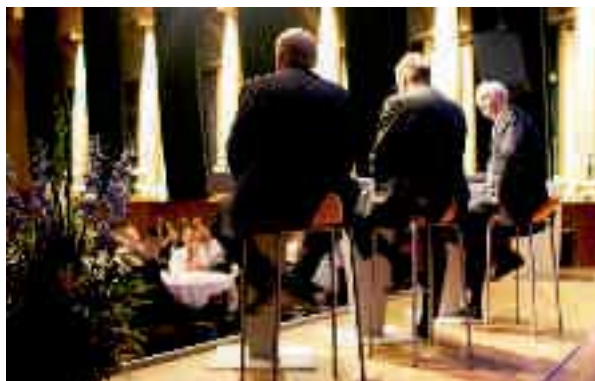
Kapitalmarknadsdag på Nalen.